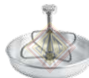
CCCA0304001 Comedero Circular para Cerdo de Aluminio