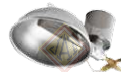
CPLX0204001 Criadora para Lechón