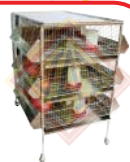
Criadoras de 1 a 5 niveles.