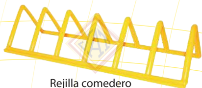
Rejilla comedero lineal 23 cm.