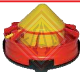
BAIP0109003 Bebedero automatico iniciación en Piso con base y rejilla.