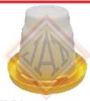
BMXX0109001 Bebedero manual de galón.