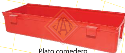
Plato comedero lineal 23 cm.